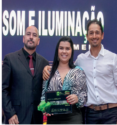
INVICTA SOM E ILUMINAÇÃO SOM E LUZ