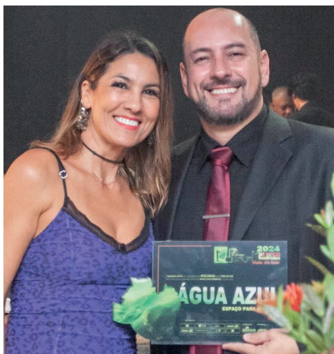
ESPAÇO PARA EVENTOS