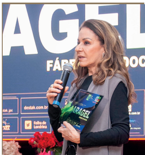
FABRICA DE DOCES