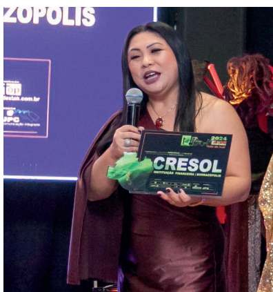
CRESOL INSTITUIÇÃO FINANCEIRA | BORRAZÓPOLIS