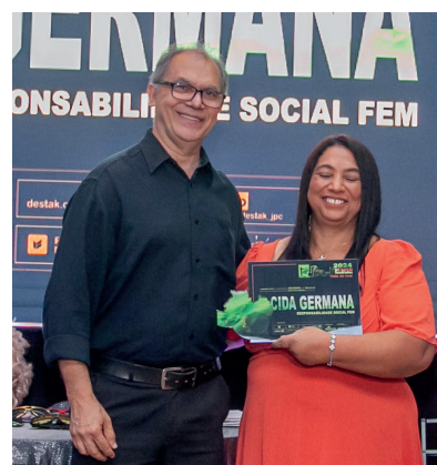
CIDA GERMANA RESPONSABILIDADE SOCIAL FEM