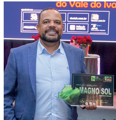
MAGNO SOL TECNOLOGIA ENERGIA SOLAR