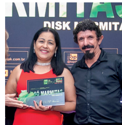
SÓ MARMITAS DISK ENTREGAS