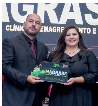
MAGRASS CLÍNICA DE EMAGRECIMENTO E ESTÉTICA