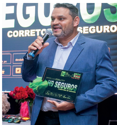
H9 SEGUROS CORRETORA DE SEGUROS