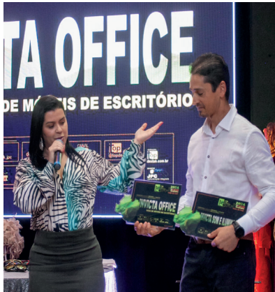
INVICTA OFFICE LOJA DE MÓVEIS DE ESCRITÓRIO