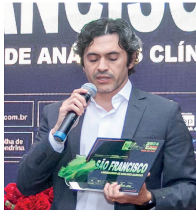
SÃO FRANCISCO LABORATÓRIO DE ANÁLISES CLÍNICAS