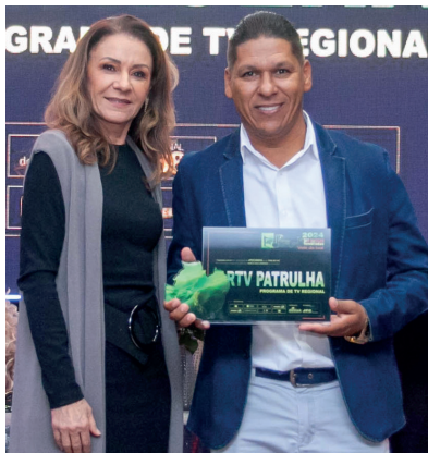
RTV PATRULHA PROGRAMA DE TV LOCAL