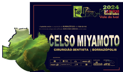
CELSO MIYAMOTO CIRURGIÃO-DENTISTA | BORRAZÓPOLIS