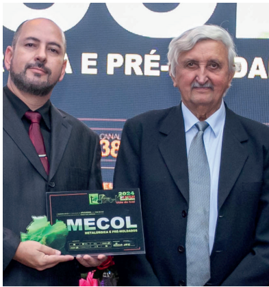
MECOL METALÚRGICA E PRÉ - MOLDADOS